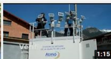
TELT | Protéger la qualité de l'air de la Maurienne.