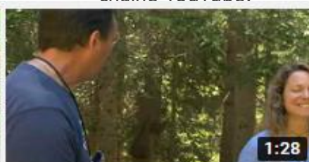
TELT | Sauvegarder la faune et la flore de #Maurienne