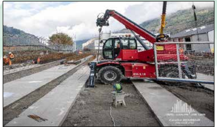
Fondations des bureaux définitifs