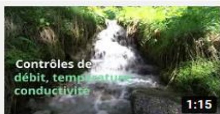
TELT | Préserver les sources en Maurienne

Pour plus d'information sur la préservation des sources sur les chantiers, les travaux de sauvegarde de la faune et la flore et sur la protection de la qualité de l'air en Maurienne, visitez notre site internet www.telt.eu et notre chaîne YouTube.