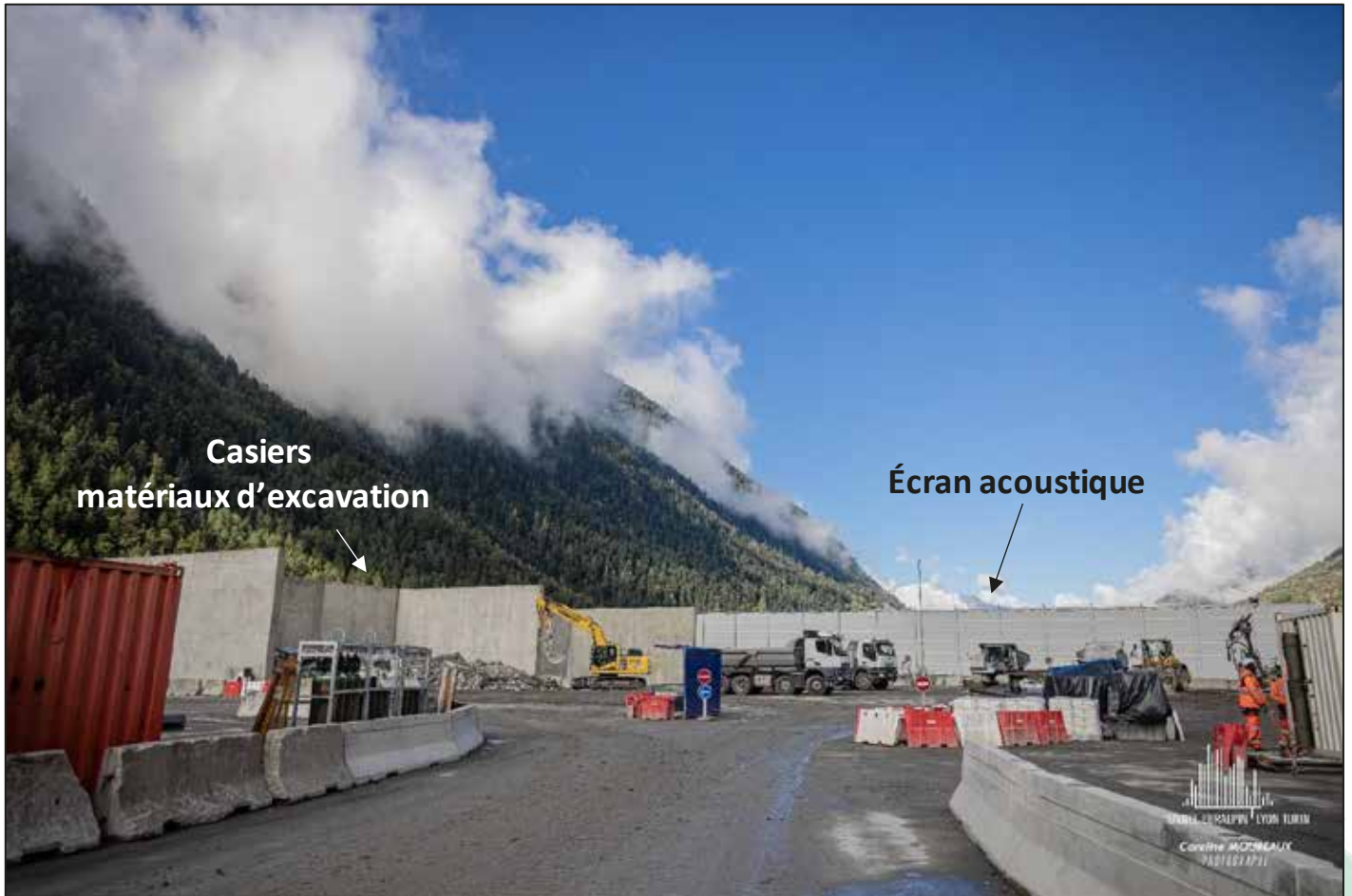
Plateforme chantier - La Praz